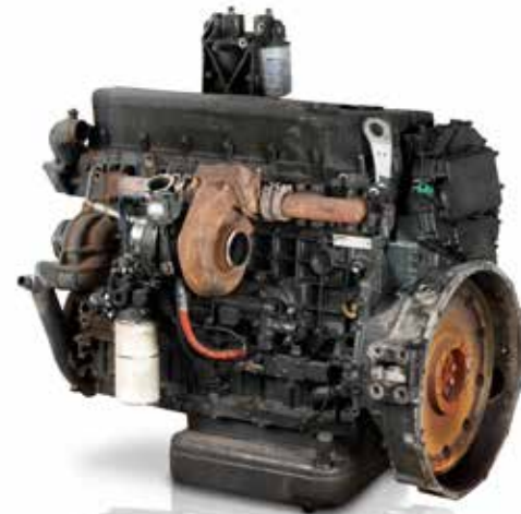
Exemple d'un moteur dont l'entretien a été négligé.

Votre filtre à huile est essentiel au bon fonctionnement de votre moteur. Son rôle ? Retenir toutes les particules qui ont un effet abrasif sur les pièces mécaniques en rotation, telles que le vilebrequin, l'arbre à came ou encore votre turbo. Grâce à son média multi-couches, le filtre à huile IVECO est résistant et sa capacité de filtration est bien plus élevée qu'un filtre à huile bas de gamme. Mais vous n'en doutiez pas ; inutile d'en rajouter une couche.